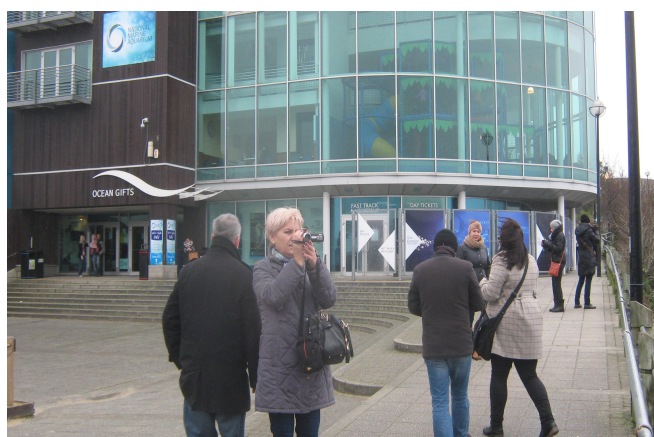
Grupa uczestników projektu przed muzeum marynistycznym

Zespół Szkół Ogólnokształcące – Technicznych w Lublińcu