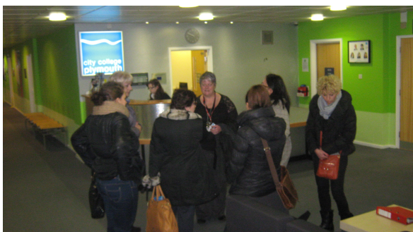
Zawodowa wizyta w City College Plymouth

Po ukończeniu 16 roku życia uczniowie mogą kontynuować naukę w klasach 12 i 13 (college) przygotowujących do egzaminów na poziomie A Level (tzw. dużej matury wymaganej przy przyjęciu na studia). Egzamin przeprowadza General Certificate of Secondary Education (GCSE), zdawany z 6-10 przedmiotów. Z każdego z nich można uzyskać oceny od A (najwyższa nota) do G. Uzyskany wynik może decydować o przyjęciu do szkoły średniej. General Certificate of Education Advanced Level (A-level) oraz Advanced Supplementary (AS) zdawane są na zakończenie nieobowiązkowych ostatnich dwóch lat szkoły średniej (12 i 13). AS są egzaminami uzupełniającymi, dzięki którym uczniowie mogą wykazać się wiedzą zgodną z ich indywidualnymi zainteresowaniami. Na poziomie A level zdaje się od 2 do 4 egzaminów, przy czym muszą one być wcześniej zaliczone na poziomie GCSE. Prace uczniów ocenia się w skali od A (najlepsza nota) do E.