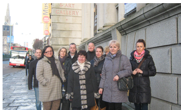
Grupa uczestników projektu przed City Museum & Art Gallery w Plymouth

Zespół Szkół Ogólnokształcąco – Technicznych w Lublińcu