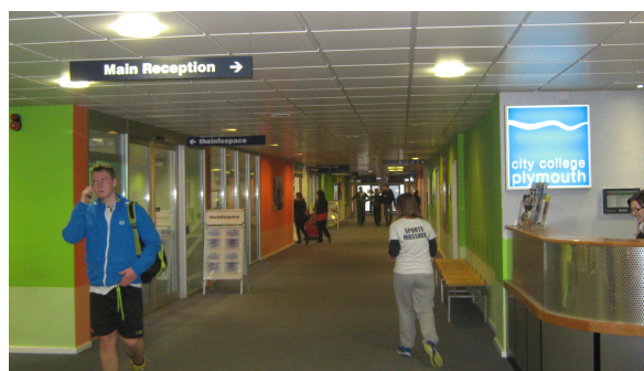
City College Plymouth