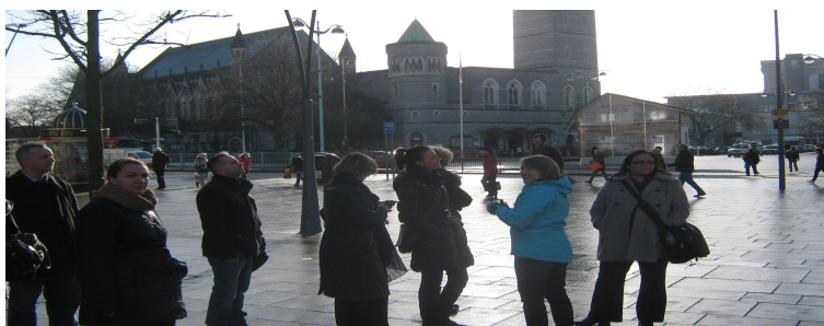
Zwiedzanie Plymouth z przewodniczką

Zespół Szkół Ogólnokształcące – Technicznych w Lublińcu