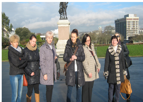
Zwiedzanie Plymouth z przewodniczką