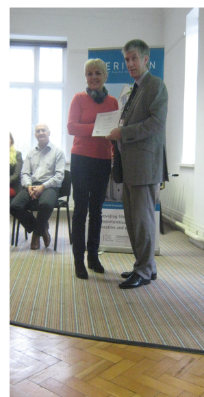
Wręczenie certyfikatów w firmie Tellus Group

Zespół Szkół Ogólnokształcąco – Technicznych w Lublińcu