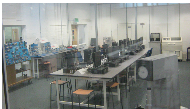
Pracownia montażu i naprawy komputerów