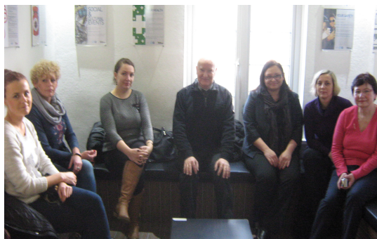
Grupa oczekująca na zajęcia w Tellus Group