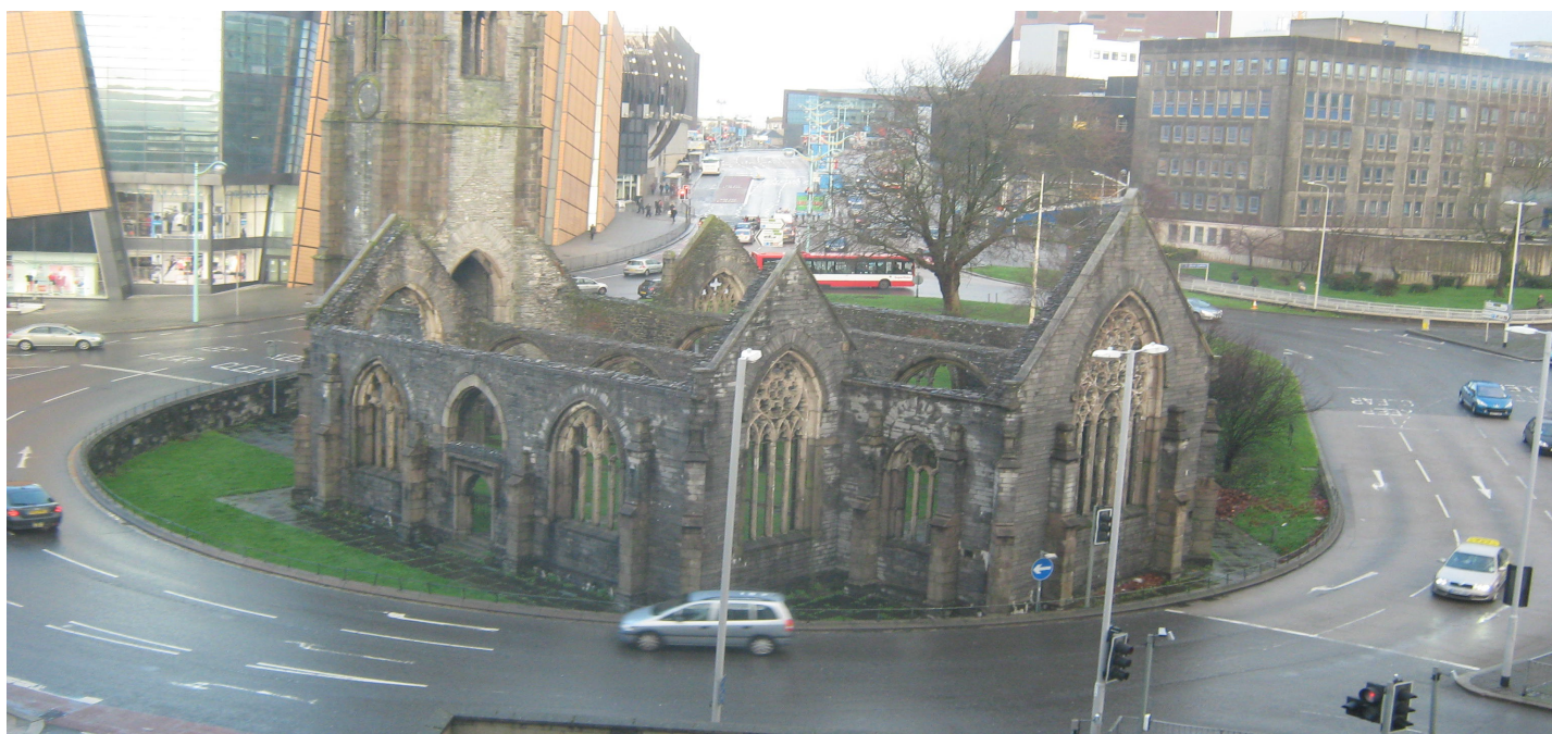
Widok z okna pokoju hotelu Jury's Inn