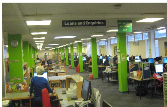
Sala lekcyjna ekonomiczna